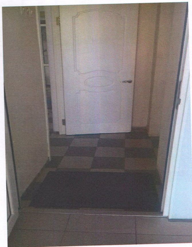
Φοτο Νο 5