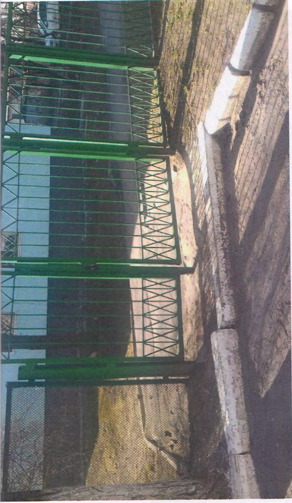
Φοτο Νο 2