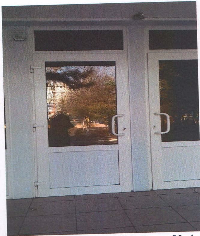
Φοτο Νο 4